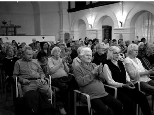
Der gut gefüllte Stiftungssaal während der Feierstunde, darunter viele Besucher, Gäste und Angehörige.