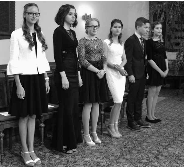
Konfirmation Pfingsten 2018 (Martinskirche Bernburg)