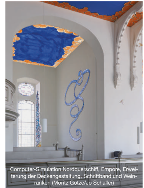
Computer-Simulation Nordquerschiff, Empore, Erweiterung der Deckengestaltung, Schriftband und Weinranken (Moritz Götze/Jo Schaller)

Ermöglicht wird dieser Abschnitt durch eine erneute Förderung seitens des Vereins Ausstellungshaus für christliche Kunst e.V. München. S. Baier